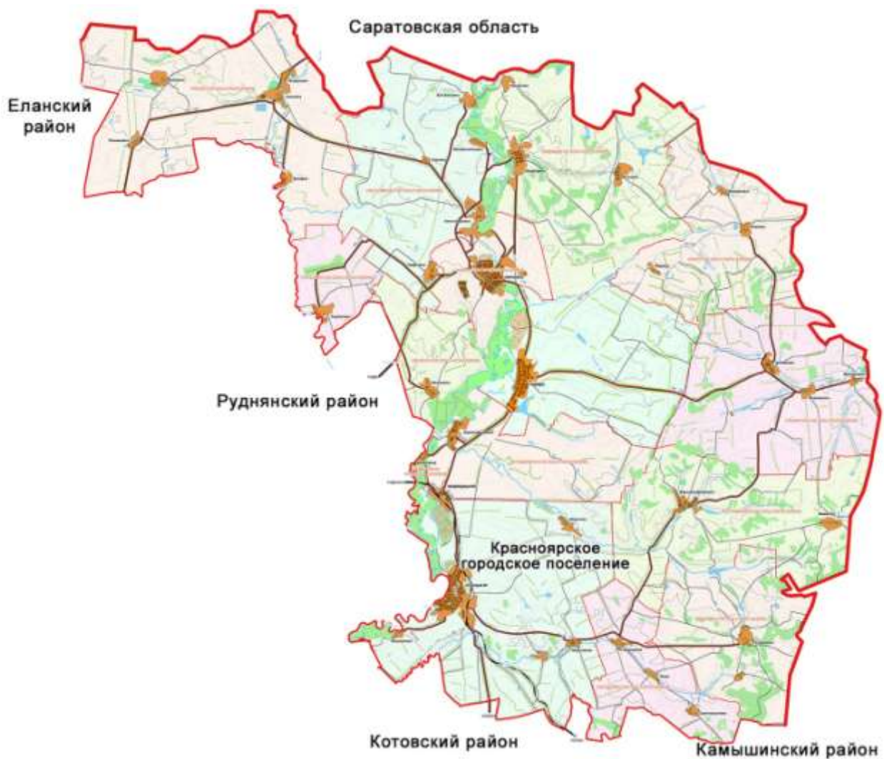
Рисунок 1. Ситуационная схема размещения Красноярского городского поселения.

В Красноярское городское поселение входят: - рабочий поселок Красный Яр – центр поселения;